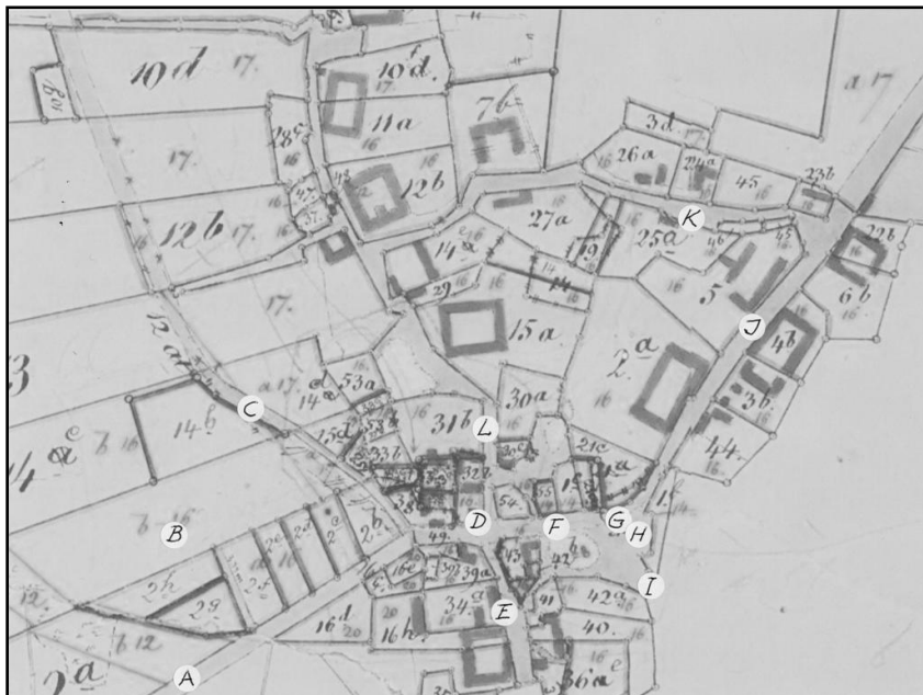
Stensballe by. Opmålt af Wesenberg i 1782. Omarbejdet i 1893 af Sôderberg. Historisk kort fra Kort- og Matrikelstyrelsen.

På omstående side findes et kortudsnit over Stensballe by for nævnte periode. Heraf ses, hvor tæt de mange gårde og beboelser lå. Efter midten af 1800-tallet begyndte gårdene en udflytning til deres marker (mere effektivt landbrug), og en del gårde fortsatte med havebrug (persillekræmmere). Ligeledes skete der en del opførelser af nye beboelser, idet Stensballegaard fik brug for arbejdskraft.