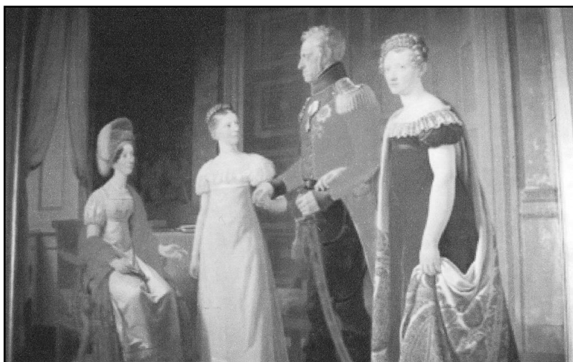
Kong Frederik 6. med dronning Marie Sophie Frederikke og deres to døtre. Maleriet findes på Rosenborg.