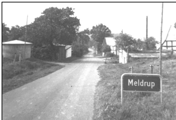
Vejen gennem Meldrup, ca. 1970.