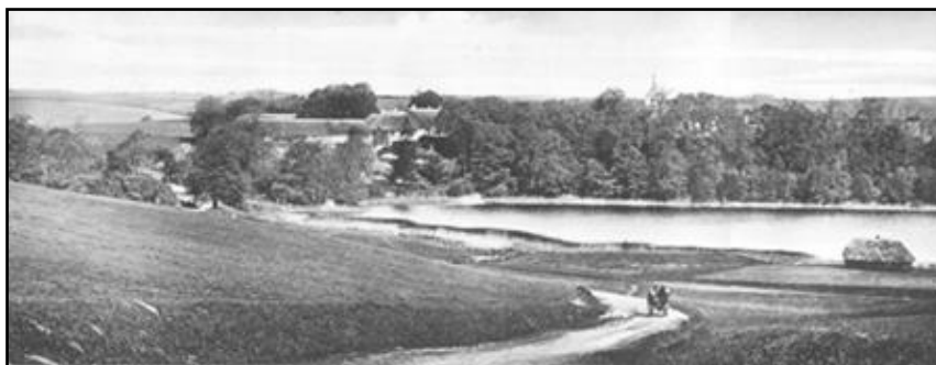
Vær sø med den gl. Præstegård. Bygget i 1654 og brændt i 1925. Skættehus th.