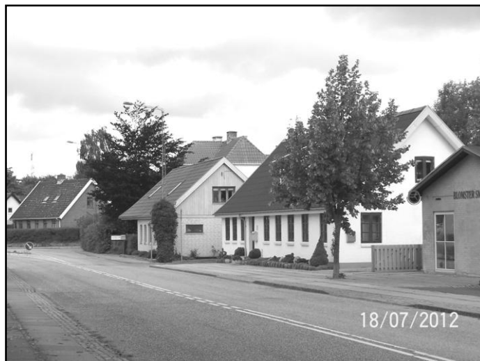
Huset Bygaden 81 set fra øst, 2012.