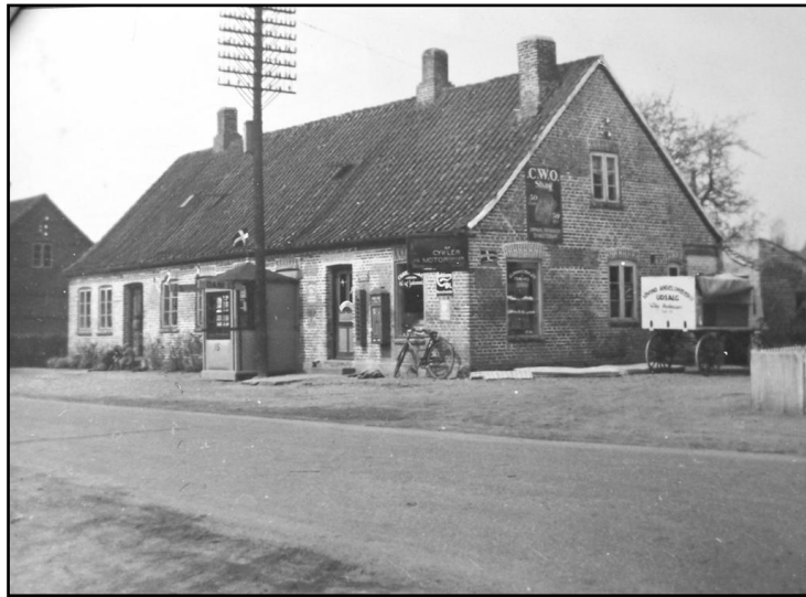
Huset Bygaden 81 i 1935. Det er nu forlænger med 3 fag. I huset er der telefoncentral i den vestlige og mælkeudsalg i den østlige del..