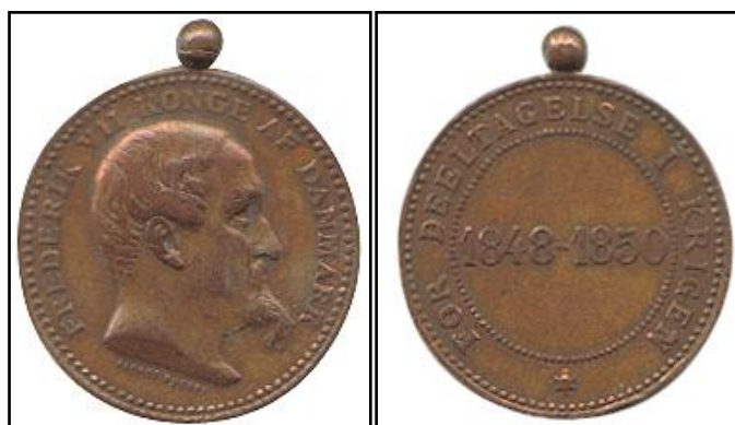
Erindringsmedalje for deltagelse i krigen 1848-50.

Det blev i 1848 vedtaget at indstifte en medalje for tapperhed i krigen. Den blev præget, men i 1851 blev det besluttet, at de ikke skulle uddeles, og de blev alle omsmeltet. I 1872 ansøgte en komite' om en erindringsmedalje for deltagelse i krigen. Dette blev vedtaget i 1875, og i februar 1877 blev der uddelt 40.000 eksemplarer af medaljen.