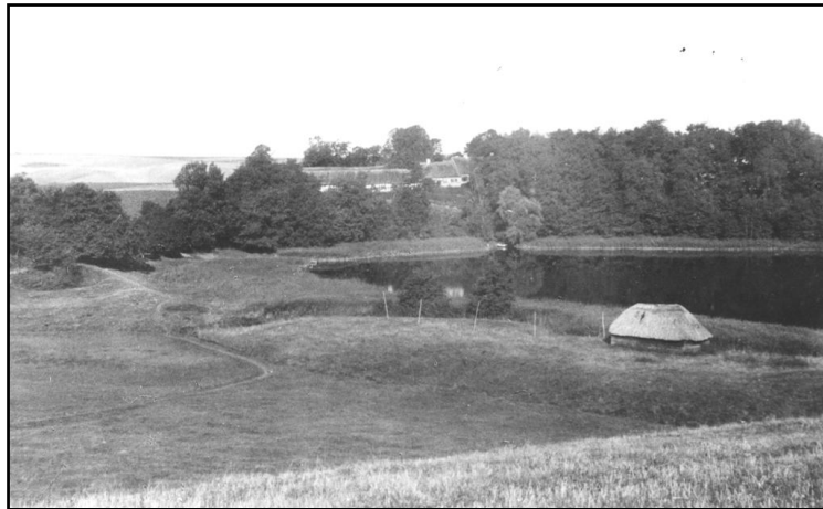
Vær gl. præstegård, der nedbrændte i 1927. Foto ca. 1914.