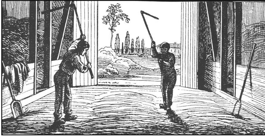
Kornets tærskning udførtes med håndkraft og plejl. Tegning af G. Knudsen.