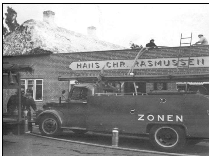
Bygaden 66. 28. august 1952