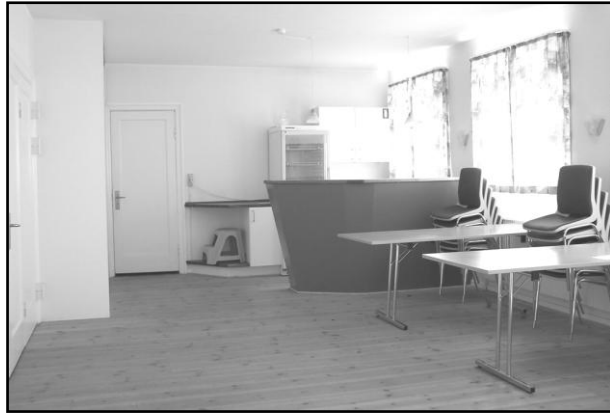
Den lille sal. Foto 2014.