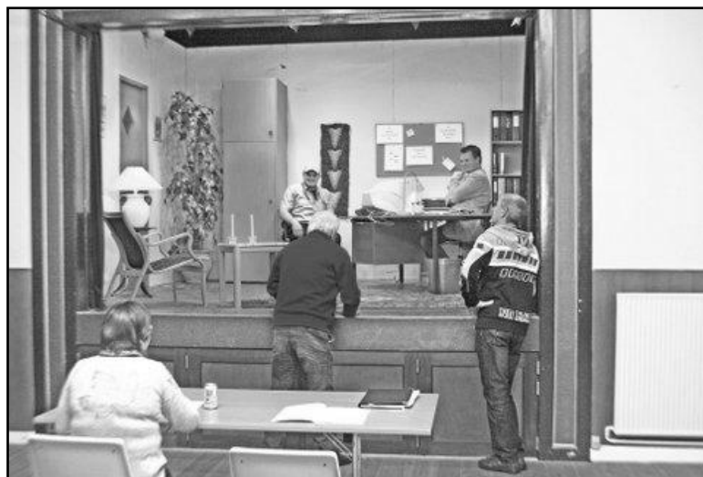
Scenen i store sal. Instruktion til dilettantforestilling. Foto 2015.

Forsamlingshuset rummer en stor og en lille sal. I den store sal er der scene med dertil hørende faciliteter, og den har plads til 100 spisende gæster. Den lille sal har plads til 25 spisende gæster. I husets ene fløj er der gode garderobe- og toiletforhold, og i den anden fløj ligger køkkenregionerne. Ovenpå var der i mange år en lejlighed til forsamlingshusets vært, men den er i dag inddraget til Nebel Sogns Museum, der viser ting og sager indsamlet gennem tiderne i Nebel sogn, og samtidig har museet også funktion som lokalarkiv.