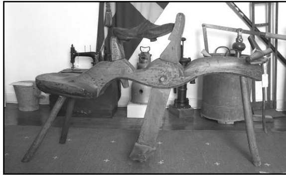
Museet: Traskomagerbænk. Foto 2014.