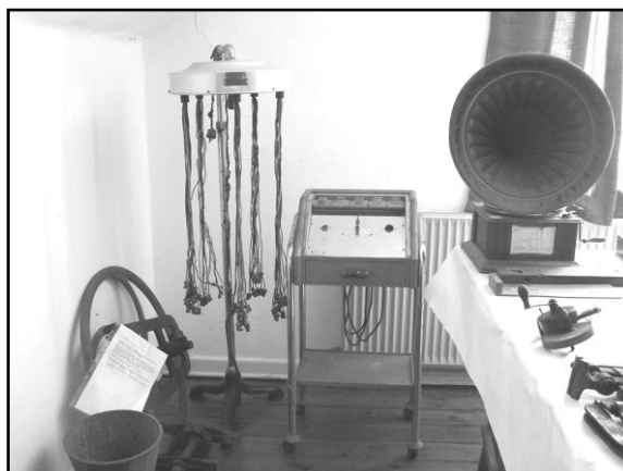
Museet: Krøllejern til 50 krøller fra frisørsalon. Foto 2014.

Museet blev startet i 1984 og ligger på 1. sal, som også rummer Serridslev Lokalarkiv.