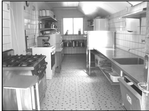
Køkkenet. Foto 2014.