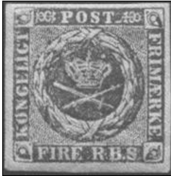
Danmarks første frimærke. Fire R. B. S. (4 rigsbankskillinger). Det dækkede enhedstaksten for et ufrankeret indenlands brev. (Optræk fra Post & Tele Museum).