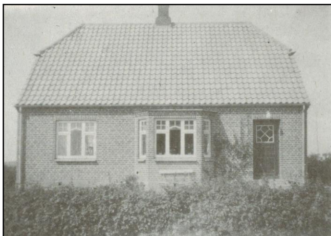
Huset på Husoddevej 16. Foto ca. 1960. I dag er overetagen blevet forsynet med karnapper.