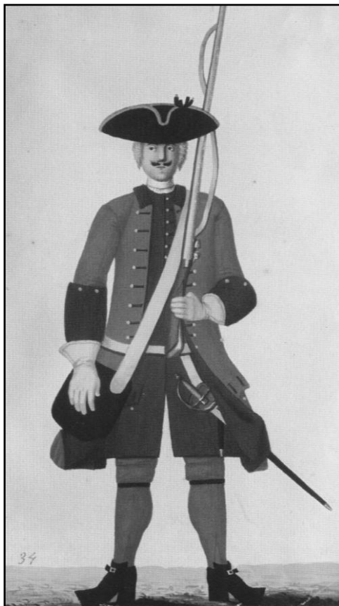
Dansk infanterist (fodfolket) på Frederik d. 4. tid