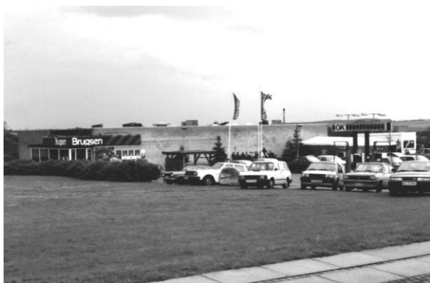
Brugsen på Brådhusvej, 1974

I 1960- og 1970'erne havde landsbyen Stensballe vokseværk. Flere og flere tilflyttere kom til. Vær-Nebel Kommune blev nedlagt i 1970, og Stensballe blev en forstad til Horsens. Brugsens omsætning var steget fra 200.000 kr. i 1931 til 2.300.000 kr. i 1973, og Brugsens lokaler fandtes for små. Derfor blev der i 1970 lavet en plan til inddragelse af uddelerens beboelse til forretning. Horsens Kommune kom ind i billedet, men kunne ikke godkende udvidelsen, medmindre Boligministeriet gav dispensation. Det troede bestyrelsen ikke rigtig på. Interessen samlede sig i stedet om en plads i et butikscenter, der tænkte etableret på hjørnet af Bygaden og Brådhusvej. FDB (Fællesforeningen for Danmarks Brugsforeninger) igangsatte markedsanalyser af Brugsens fremtid i Stensballe (og de fandtes positive). I 1973 købte Brugsen for 125.000 kr. en grund på 10.000 m 2 på Brådhusvej 3, og i 1974 igangsattes bygning af en ny Brugs. Allerede i 1972 var Brugsen gået fra diskbetjening til supermarkedetsdrift.