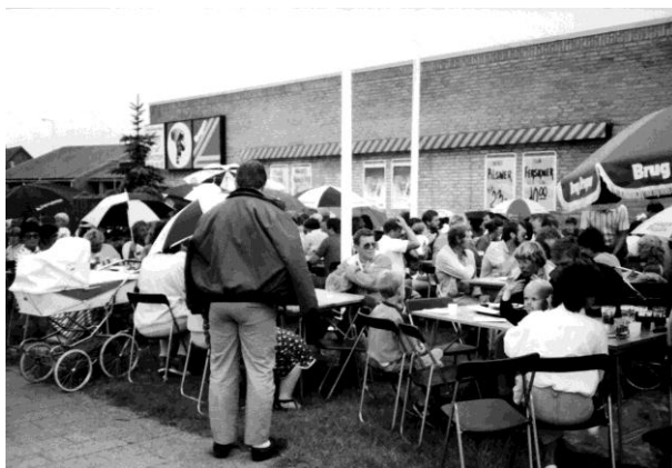
Brugsens sommer-grillfester var et tilløbsstykke. De startede i 1984 som en fejring af Brugsens 75 års jubilæum

udvidet med en fast repræsentant fra personalet. Fra starten i 1974 tog omsætningen et gevaldigt hop opad, senere mere jævnt, men altid stigende. Det samme gjorde omkostningerne, og avancen blev mindre med årene. I Brugsens levetid på Bråddhusvej var der gode år, men flest dårlige, hvilket betød, at FDB i 2003 besluttede at lukke Brugsen. Uddeler, personale og butiksbestyrelse samt FDB gjorde sig ellers gennem årene de utroligste anstrengelser for at øge omsætningen og avancen.