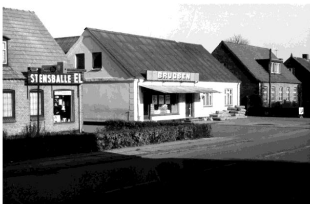
Brugsen på Bygaden 69, 1973

Første protokollerede bestyrelsesmøde var den 20. juni og generalforsamling den 1. juli 1909. I 1910 købte Brugsen en grund på Bygaden 69 (skøde fra Voer og Nim Herreds-Stensballegaards Birketing) på 4 Skjr. (ca. 3500 m 2 ) for 1000 kr. til opførelse af en Brugs i egne lokaler. Senere viste det sig muligt at udstykke og frasælge to parceller fra grunden til en pris af 800 kr.