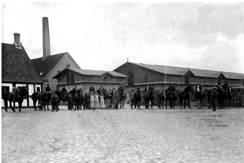
Personalet linet op til fotografering foran avlsbygningerne, ca. 1937.

blev oprettet som stamhus. Det, der nu kom til at præge haven, var en markant opdeling ved en 1 km lang allé af lind og elm, der ender på den 75 m høje "Kragshøj". Parken er på 27.500m 2 , og den blev senest renoveret i 1930.