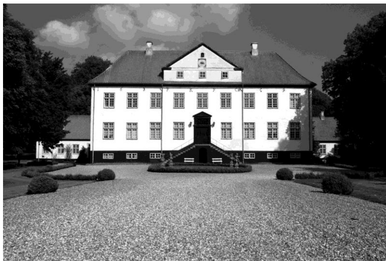
Stensballegaard, 2000.