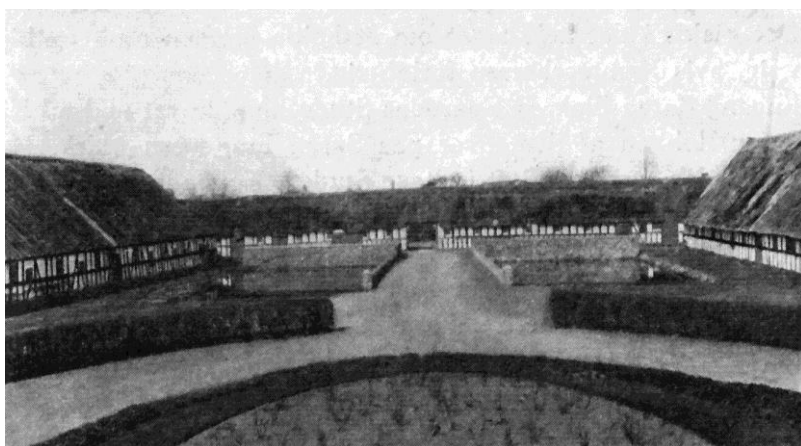
Den nedrevne stråttækte bindingsværksladegård, bygget 1694.