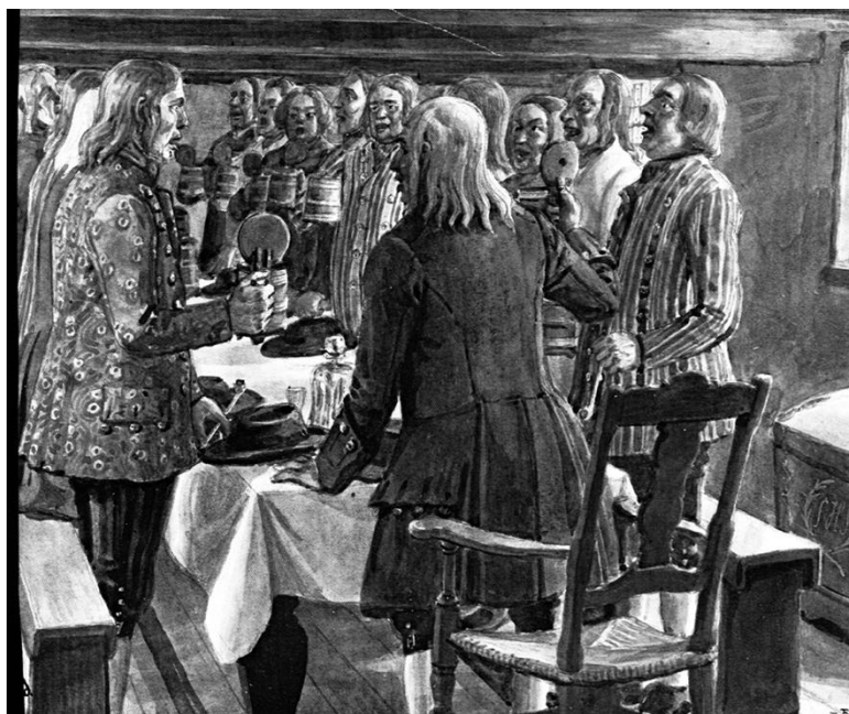
Et gilde på landet. Maleri af Rasmus Christiansen, ca. 1910.

Efter gammel jødisk ret skulle jøderne betale tiende til deres præster, da disse ikke måtte eje gods. Samme krav indførtes i år 585 af den katolske kirke på Mácon-konciliet i Frankrig.