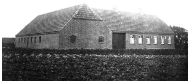
Helga's barndomshjem på Hovmarksvej, ca.1933.

2 piger på 10 og 12 år, som jeg hurtig blev gode venner med, bl.a. kunne jeg hjælpe dem med lektierne. Jeg blev sendt af sted i mange ærinder, bl.a. til biblioteket i Serridslev for at bytte bøger for fru. Jeg spillede også håndbold i Serridslev, og kom hurtigt på hold. Der var ellers nok at gøre på gården, så jeg havde fart på fra morgenstunden. Haven var stor, og jeg var naturligvis også med i roerne. Karlene var flinke at arbejde sammen med. Der var mødding i gården. Det gav flueplage, så jeg måtte pudse vinduer 2 gange om ugen. Når det var helt galt i køkkenet, tog fru. og jeg hver et viskestykke og åbnede alle vinduer og jagede alle fluerne ud i skyggesiden, så længe det varede. Om vinteren havde jeg værelse ovenover pigernes værelse med en pragtfuld olmerdunsdyne. Den var jeg meget glad for. Om sommeren flyttede jeg hen i den anden ende af stuehuset. Her fik jeg halm i sengen, som jeg selv hentede, rent og tørt ovre i laden, og jeg sov godt.