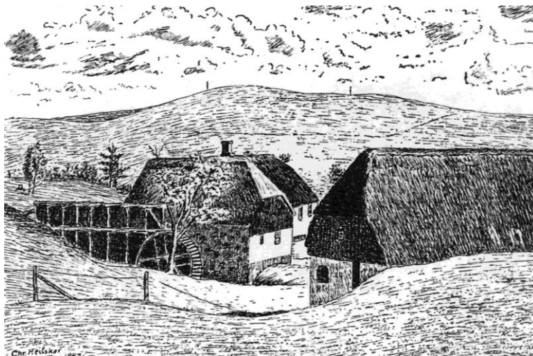
Blirup Vandmølle. Tegning af Chr. Heilskov.

Mit barndomshjem lå nær møllen, og jeg besøgte den ofte sammen med min far, når vi skulle have vort korn malet. Jeg mener, at møllen ophørte med sin drift omkring 1934. I dag findes der kun svage spor af møllen.