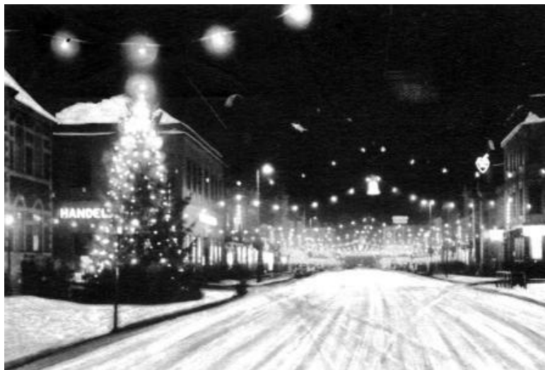
Julestemning Søndergade i 1951.

Julehøjtiden varede til helligtrekonger, så var det hverdag igen, og skolen begyndte.