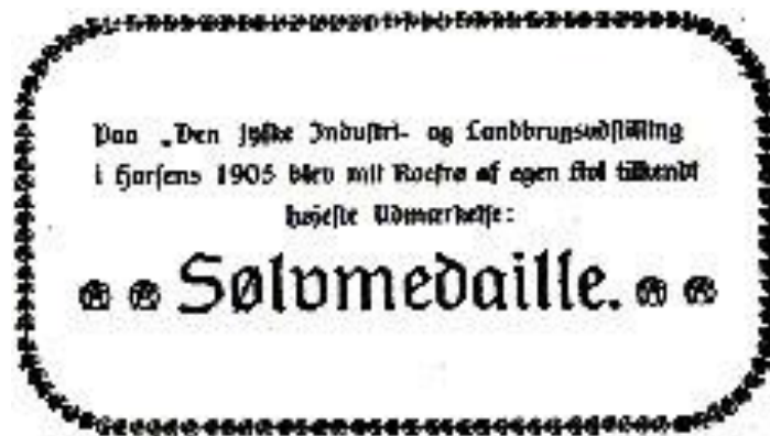
Reklame i brochure fra Østergaards Frøavl, 1909.

og fremstilling af sukker. Yderst vigtige produkter dengang. 50 år senere beskæftigede firmaet mere end 100 medarbejdere.