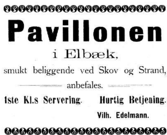
Fra udstillingskatalog. Tv. Krokodillepavillonen. Th. Pavillonen i Elbæk.

Diplom af 1. klasse med sølvmedalje var udstillingens højeste anerkendelse. Den blev givet til 115 udstillere. Denne udmærkelse tilfaldt bl.a. det 17 år gamle Stensballefirma Østergaards Frøavl (etableret 1884). Det fik stor betydning for firmaet, der var inde i rivende udvikling med hensyn til nye typer af roefrø, henholdsvis til foderbrug