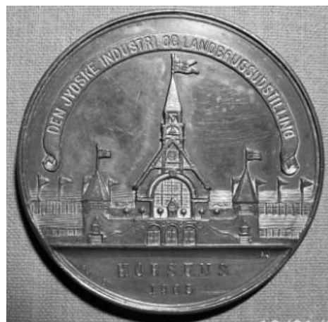
En kobbermedalje fra udstillingen. Tv. Horsens byvåben. Th. Udstillingens hovedbygning.