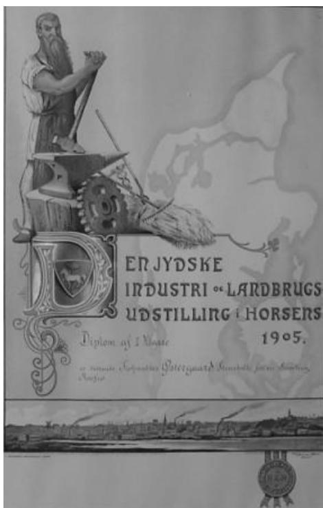
Diplom af 1. klasse og sølvmedalje givet til Østergaards Frøavl, Stensballe.

I 1905 besluttede byrådet og erhvervsorganisationerne, at Horsens skulle "sættes" på Danmarkskortet. Det skete med en storslået udstilling "Den jyske Industri- og Landbrugsudstilling i Horsens 1905". Den blev et tilløbsstykke. Hele Caroline Amalielund med nærliggende arealer, dvs. firkanten Sundvej, Carolinelundsvej, Østergade og Teglgårdsvej, var inddraget til udstilling - ca. 20 tønder land (110.000 m 2 ). Udstillingen omfattede 691 stande i opbyggede pavilloner af træ og på friland. Udstillingen varede fra 17. juni til 1. august og besøgte af ca. 200.000 gæster, hvoraf 170.000 var betalende. Horsens og Stensballe havde dengang et indbyggertal på henholdsvis 23.000 og 769.