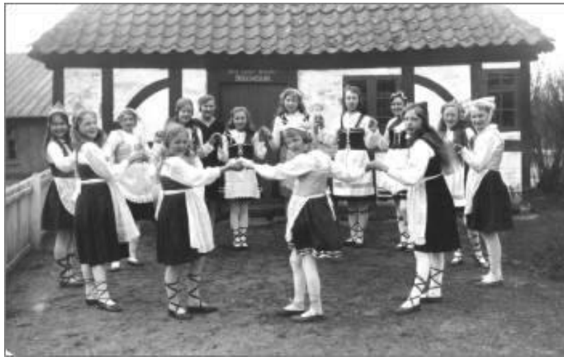
Folkedans foran museet, der ophørte i 1940. Postkort fra ca. 1930. Se Persillekræmmeren nr. 14.

Ved Ole Pedersens pensionering i 1920 blev den gl. smedje solgt til Vær Historiske Forening, der indrettede den til et lille egnsmuseum for smedeværktøj og høravl, idet afgrøden hør i 1800-tallet havde været dyrket med stort succes i Stensballe. Se Persillekræmmeren nr. 22 Førstemanden i dette arbejde var naturligvis læreren og forfatteren A. J. Gejlager (1878-1955). Museet var vanskeligere at drive end forventet, bl.a. manglede der opvarmning og opsyn. Interessen svandt, og museet blev i 1940 solgt til nedrivning.