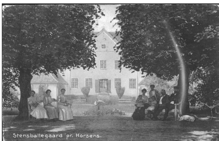
Stensballegaard set fra havesiden ca. 1890.

Stensballe har altid været et yndet udflugtsmål. Allerede før Sundbroens etablering i 1854 (se Persillekræmmeren nr. 7) søgte folk fra Horsens i stort tal ud til området, især om søndagen. I dag er det stranden ved Husodde, Naturstien og Golfbanen der trækker. Lokalarkivet har fundet tre kildeskrifter, I, II og III, der omtaler emnet, 1850 - 1935. De bringes her i uddrag.