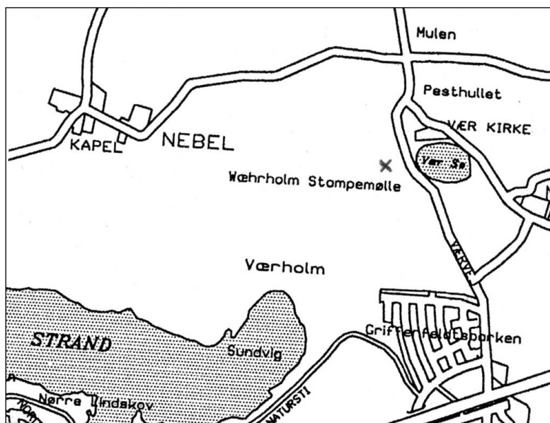
Stampemøllens placering vest for Vær sø.