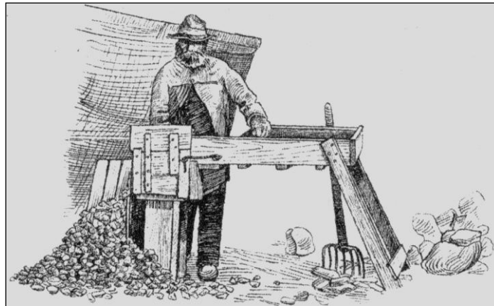
Skærvslåning af sten. Der er gode veje i Stensballe skov. Illustration fra "Lærebog for Skovfogeder", 1908