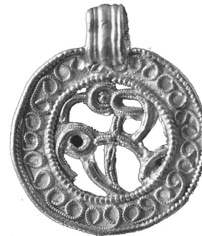
Den fundne guldbrakteat

En brakteat (af latin bractea) er en lille tynd metalplade med en indstemplet dekoration, der anvendes som smykke eller mønt. Forbilledet for disse smykker er de senromerske medaljoner, der blev givet af kejseren ved specielle ceremonier til venner, og som havde gjort sig fortjent dertil. Det regnes, at funktionen for brakteater i Nordeuropa har været af nogenlunde tilsvarende art.